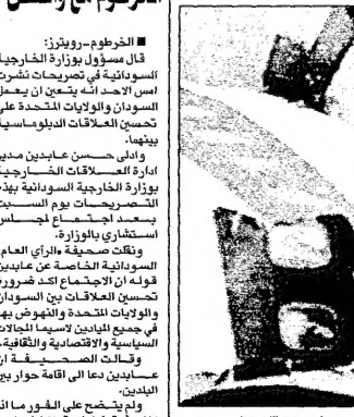
الرئيس محمد صالح والعماد والبرلمان قبل افتتاحه من قبل الرئيس السوداني

وقال مسؤول بوزارة الخارجية السودانية ان تحسين العلاقات بين السودان والولايات المتحدة امر هام. وقال مسؤول بوزارة الخارجية السودانية ان تحسين العلاقات بين السودان والولايات المتحدة امر هام.